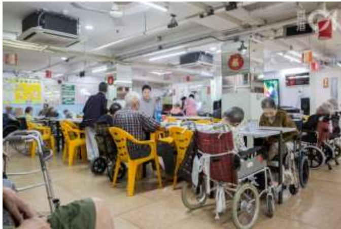
安老院認證，意指對院舍在服務、管理、護理等範疇進行質素及成效評審。（資料圖片／鄭子峰攝）

構執行，而且質素要求上並非只為滿足法例規定，而是在基本要求以外，設有可達到的最高水平，從而促使院舍提供優良服務。與社署派員突擊巡查不一樣，質素評審主要由評審員定期前往院舍實地視察，並提供改善意見；院舍在評審中不達標，並不會像違反法例監管般被警告甚至檢控，而是會被要求持續改善。